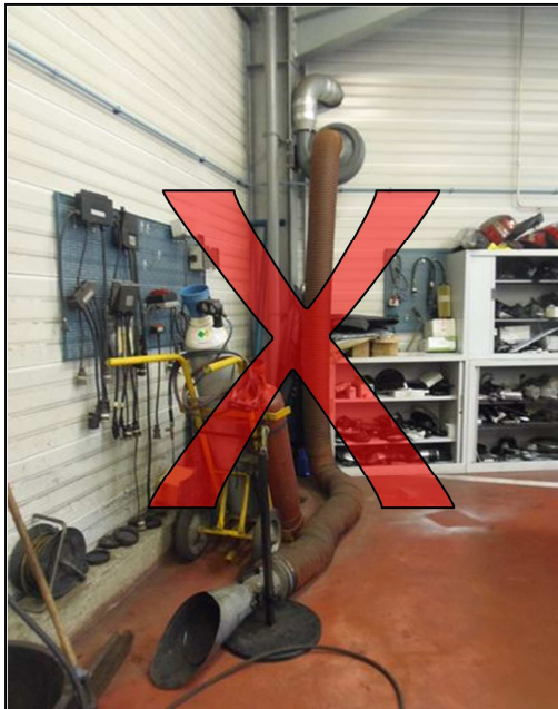
Encombrement au sol = risque de chute de plain-pied