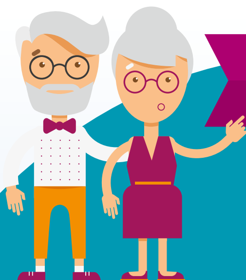
Schéma directeur ACTION SOCIALE