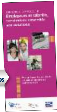
dépliant INRS ED 4195

Prévention des risques occasionnés par les déplacements professionnels, quel que soit le mode de transport utilisé (à pied, à vélo, en transports en commun, en voiture...).