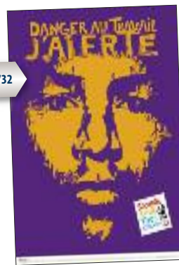
INRS AD 732