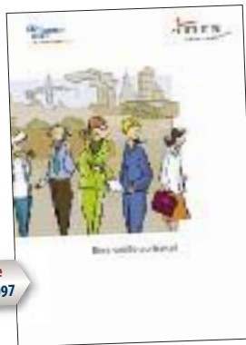
brochure INRS ED 6097

Aide aux entreprises pour agir sur les conditions de travail permettant aux salariés de tous âges de travailler jusqu'à la retraite dans des conditions favorables à leur santé, leur sécurité et leur bien-être.