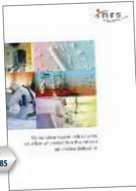
brochure INRS ED 6085

Prévention pour la réalisation de travaux d'isolation ou de protection thermique en milieu industriel mettant en oeuvre des fibres céramiques réfractaires (FCR).