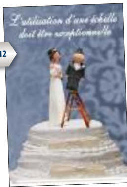
INRS AB 712