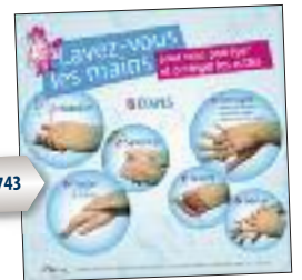
INRS AK 743