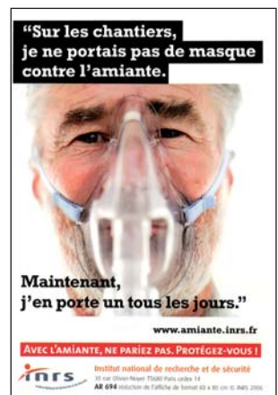
INRS AD 694