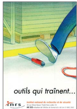
INRS AD 555