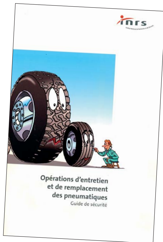
La brochure INRS ED 961, relative aux opérations d'entretien et de remplacement des pneumatiques reprend les procédures à suivre et les moyens à mettre en œuvre pour réduire les risques.

Les règles rappelées dans cet article sont le fruit d'une concertation spécifique entre la CRAM des Pays de la Loire et la Direction régionale du travail, de l'emploi et de la formation professionnelle.